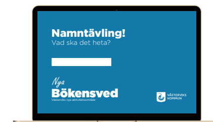
Digital kampanj och dialoghemsida