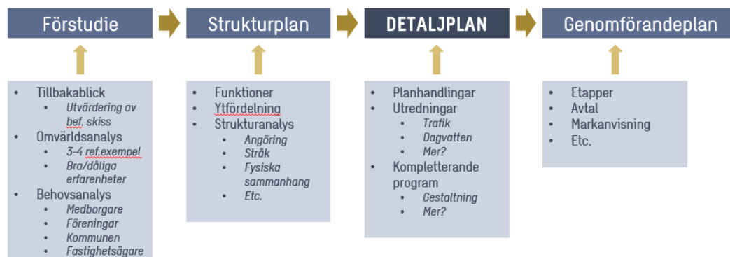
Figur 1: Processens olika steg.

samt hur området ska knytas samman med staden och dess olika funktioner. Strukturanalysen mynnar ut i ett beräknat behov och ytanspråk som det ska planeras för inom Bökensvedsområdet inför framtiden. Det blir även en enklare process om dessa frågor kan tas i en strukturplan istället för inom detaljplanprocessen. Bilden nedan visar de olika stegen och dess innehåll.